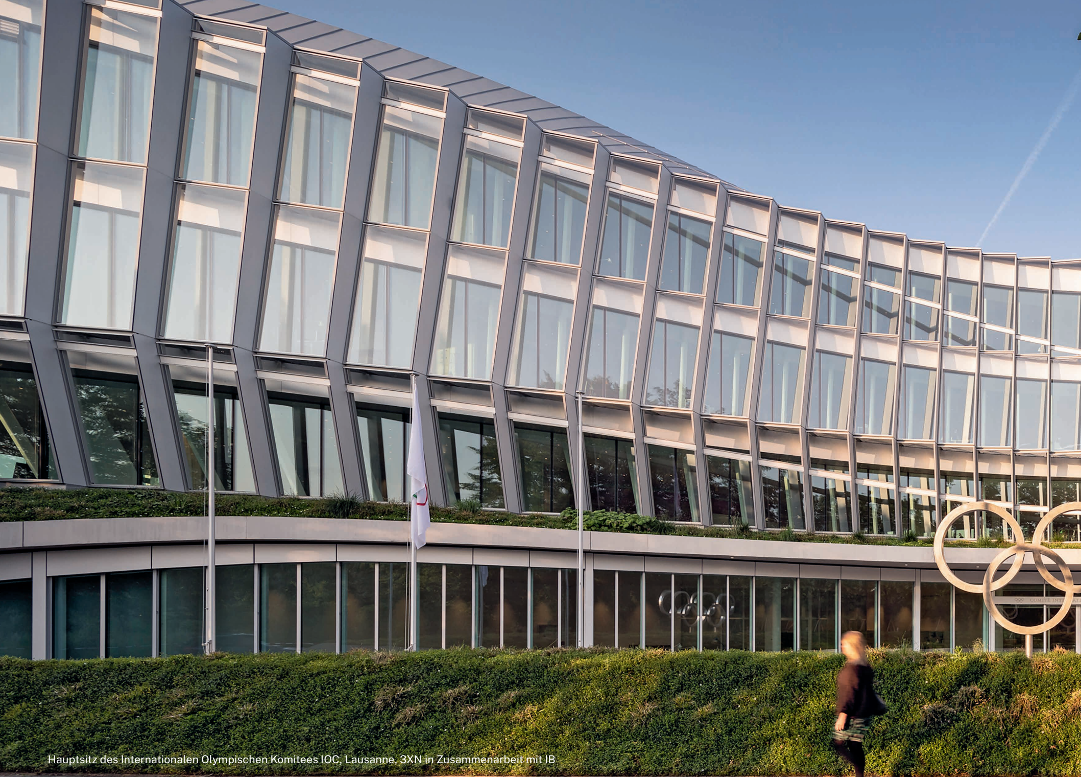
Hauptsitz des Internationalen Olympischen Komitees IOC, Lausanne. 3XN in Zusammenarbeit mit IB