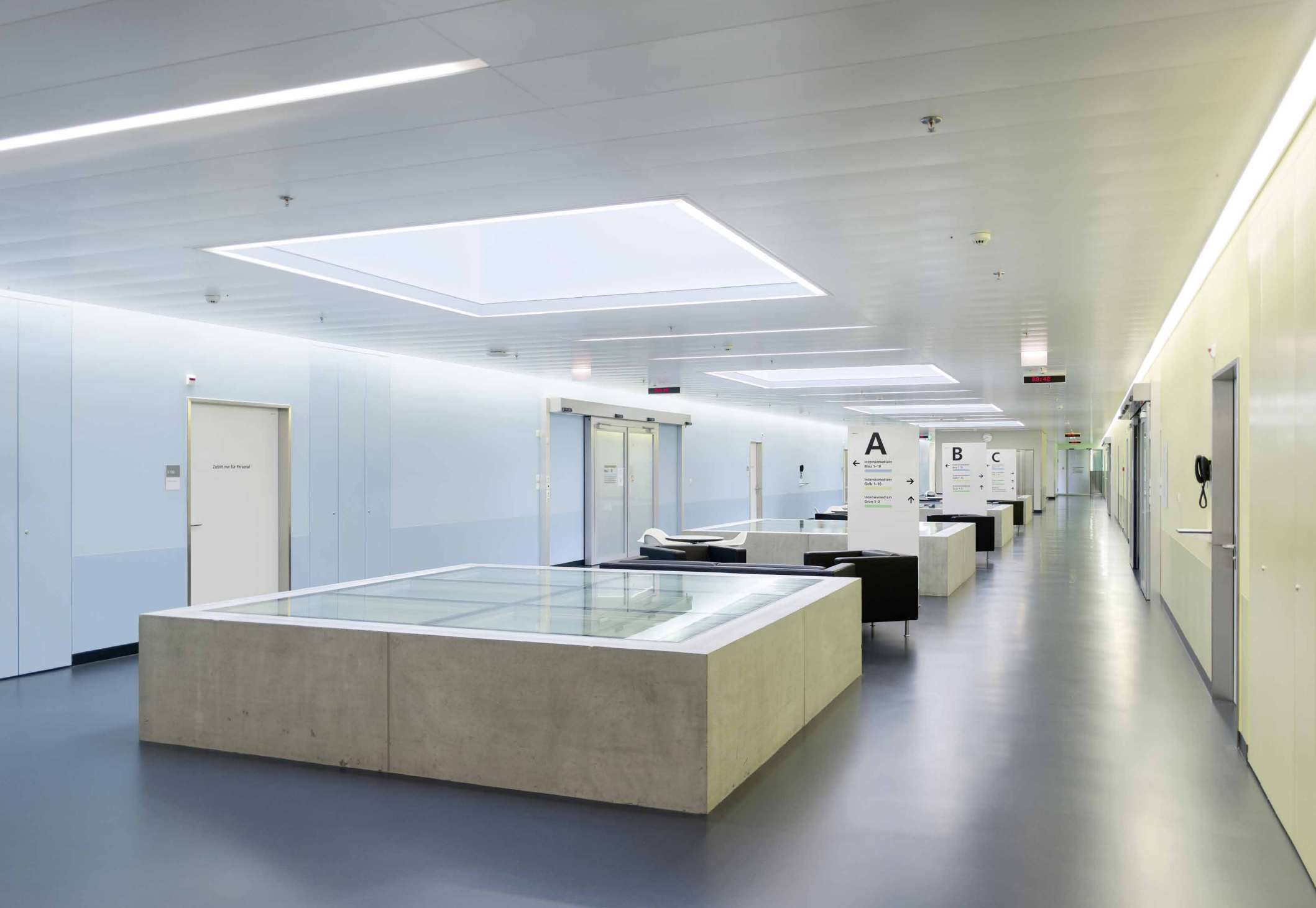
Système secondaire INO, nouveaux bâtiments, Inselspital de Berne