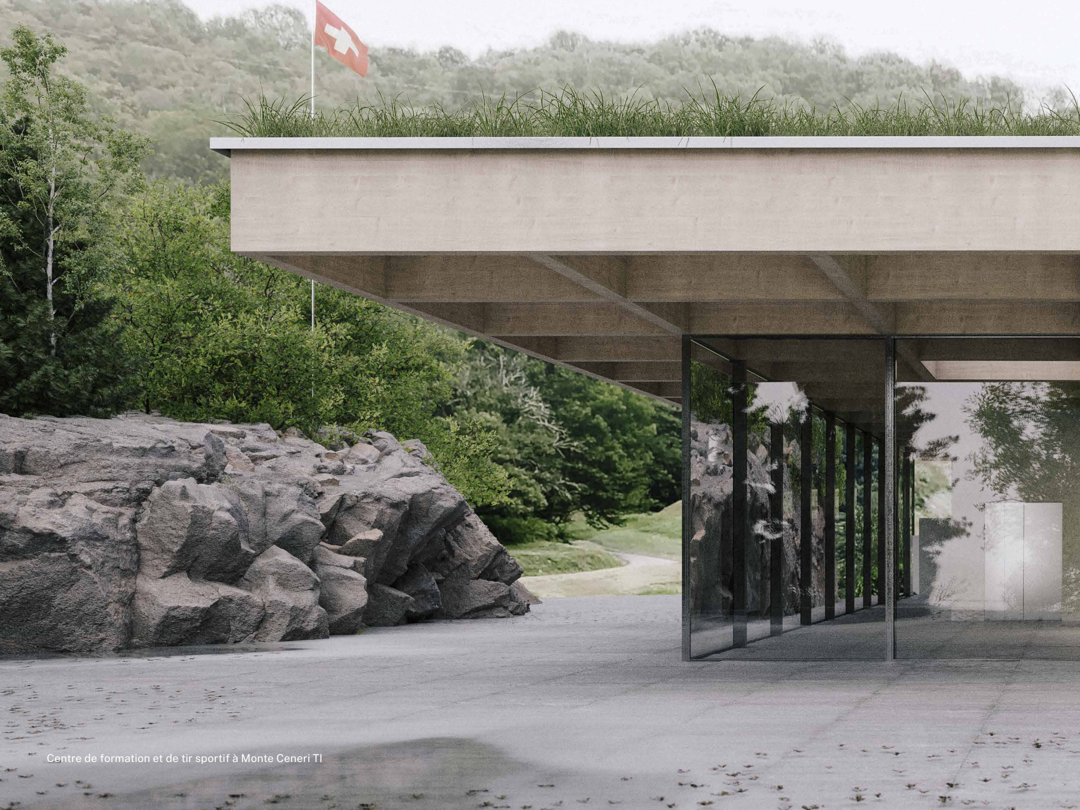
Centre de formation et de tir sportif à Monte Ceneri TI