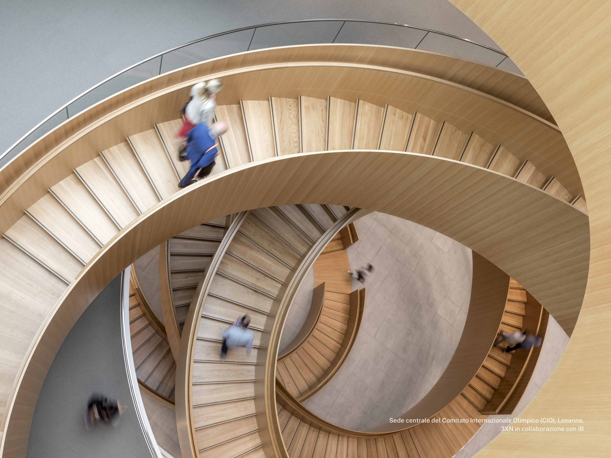
Sede centrale del Comitato Internazionale Olimpico (CIO), Losanna, 3XN in collaborazione con IB