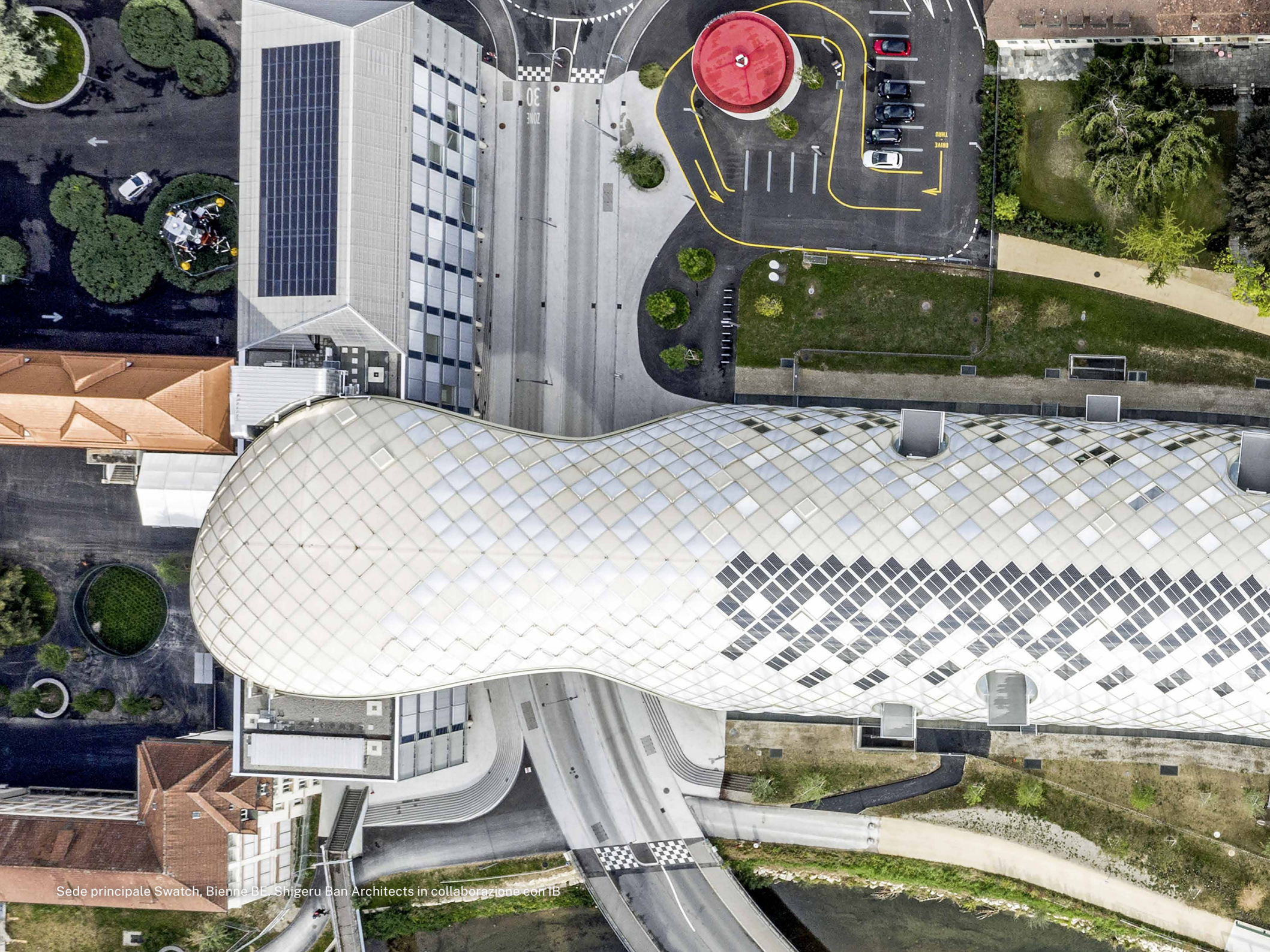
Sede principale Swatch, Bienna BE. Shigeru Ban Architects in collaborazione con IB