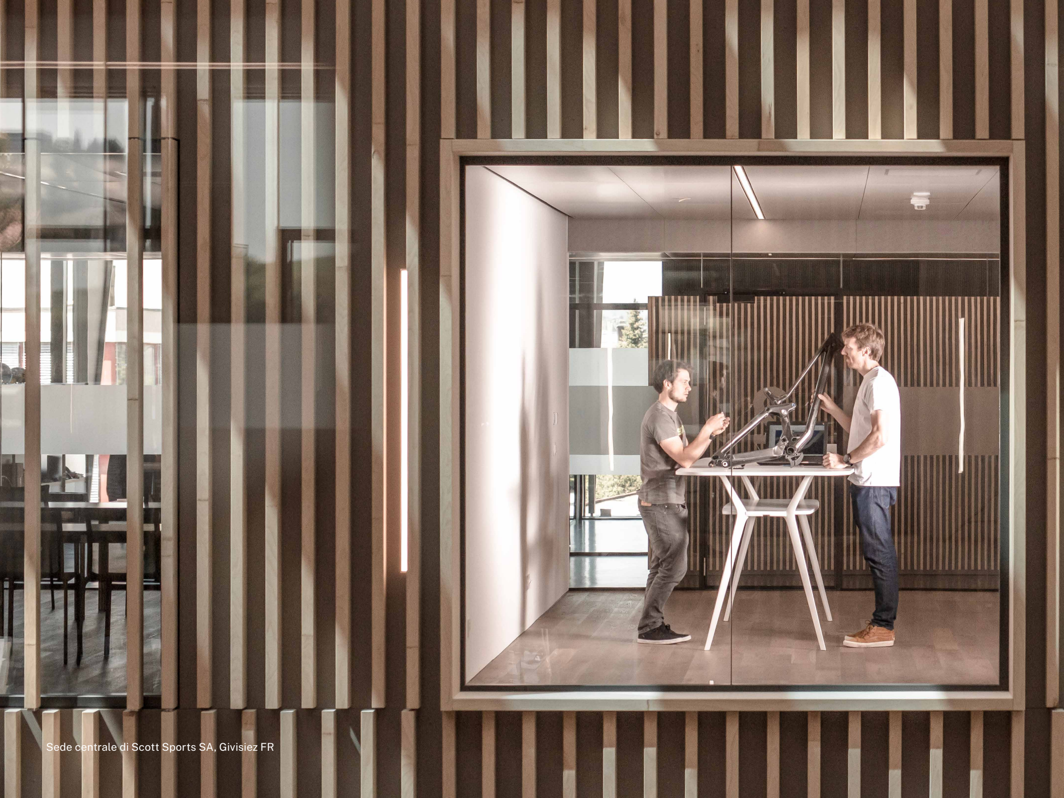
Sede centrale di Scott Sports SA, Givisiez FR