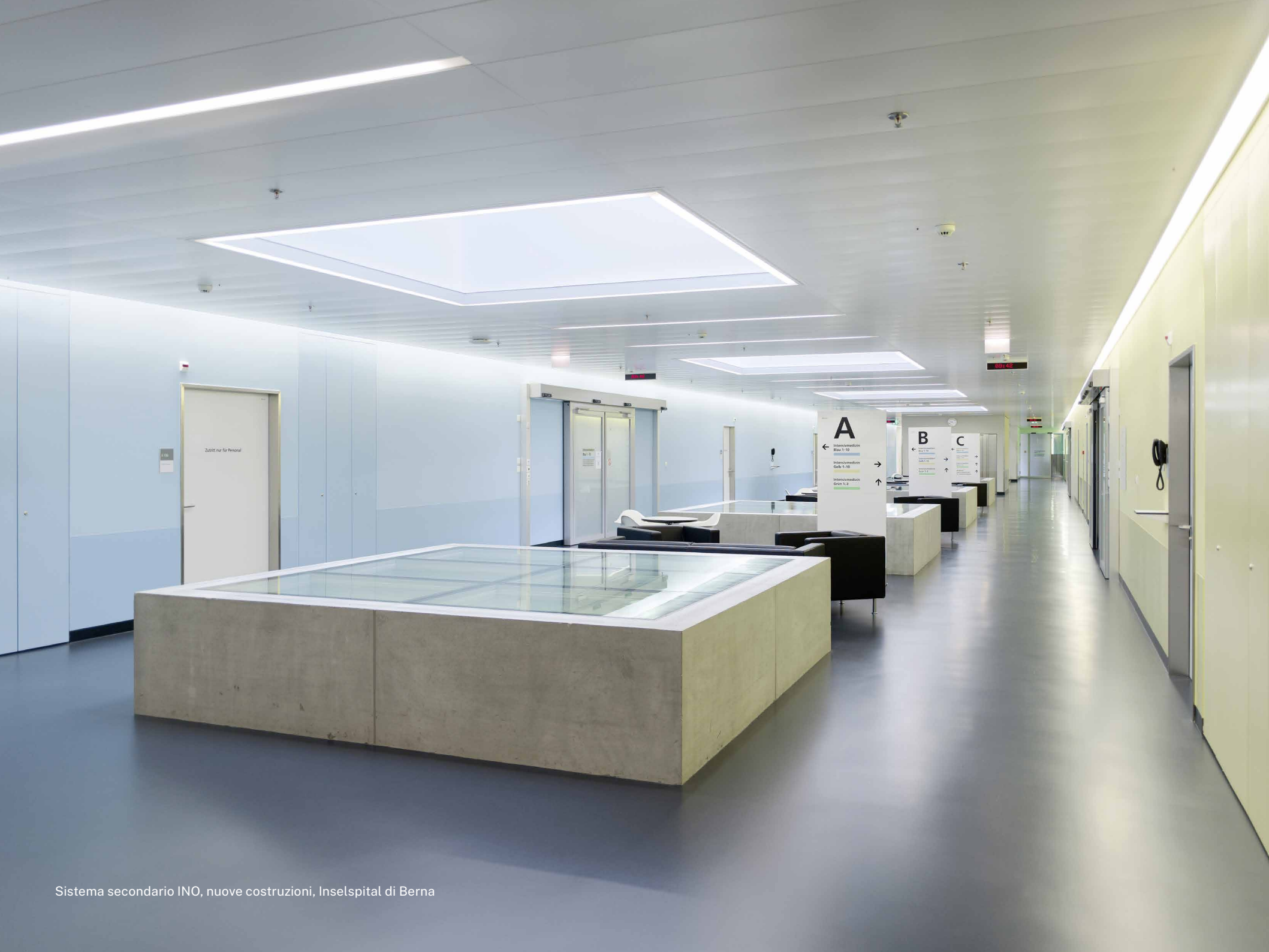
Sistema secondario INO, nuove costruzioni, Inselspital di Berna