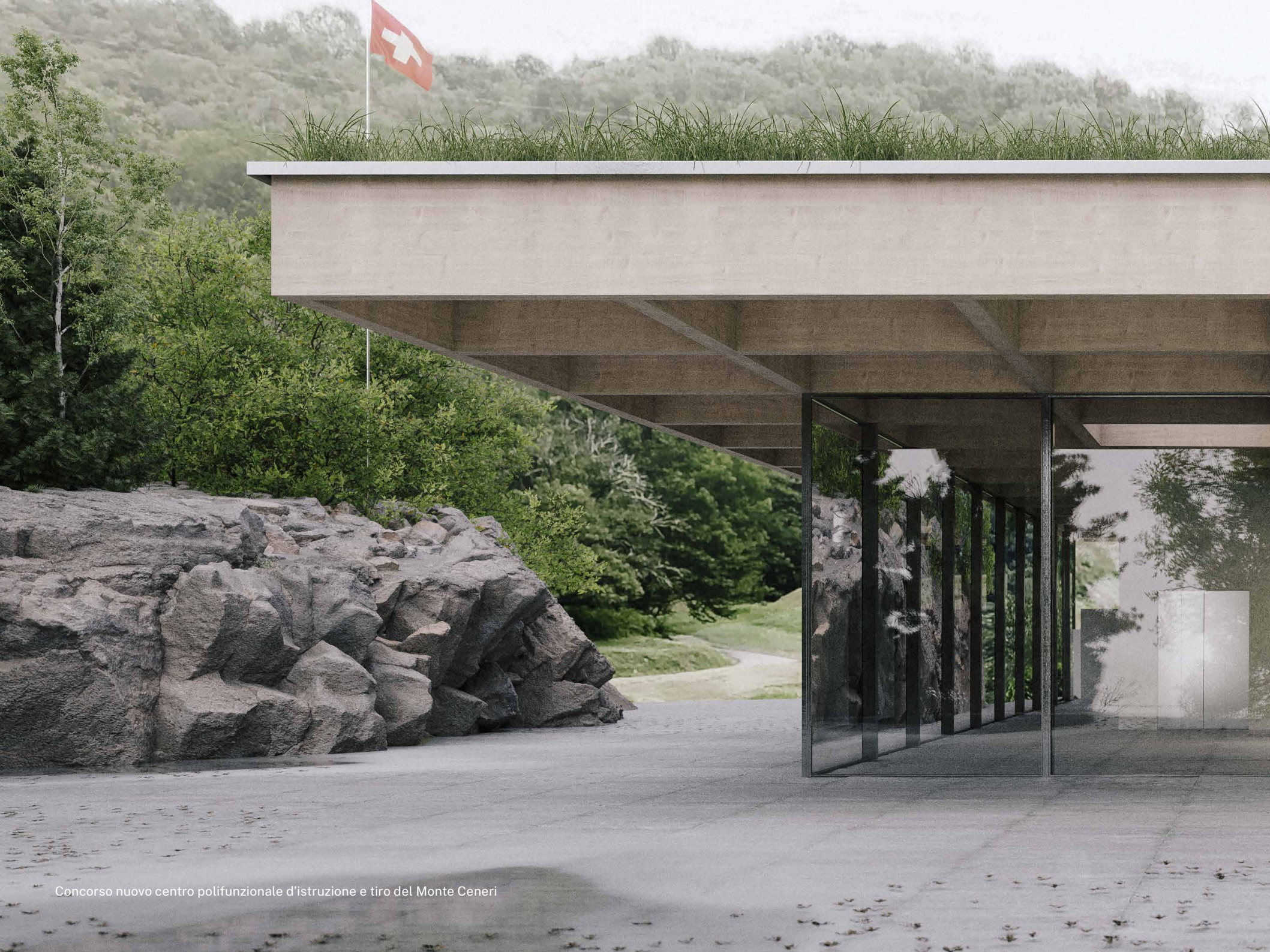
Concorso nuovo centro polifunzionale d'istruzione e tiro del Monte Ceneri